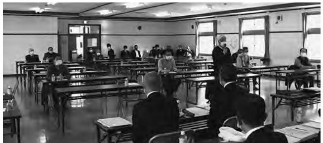
前回の町政懇談会のようす