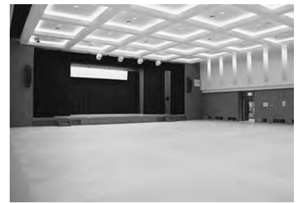
町民会館の改修工事を行いました