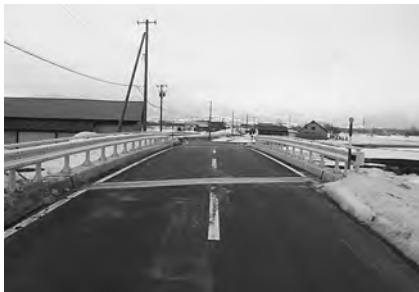
旧発足橋の架替工事を行いました