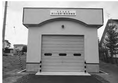
第5分団の消防団機具格納庫の建替を行いました