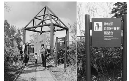
神仙沼自然休養林展望台への遊歩道の整備及び展望台に看板を設置しました。(事業費：432万円)