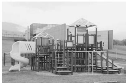
美術館下の友遊広場の遊具を改修しました。(事業費：138万円)