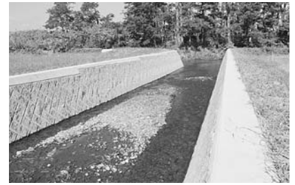
ポン神恵川改修工事を行いました。(事業費：1,139万円)