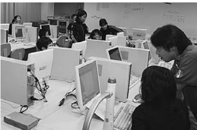
教育用コンピュータを更新し、児童1人1台で学習できるよう整備しました。(事業費：2,751万円)