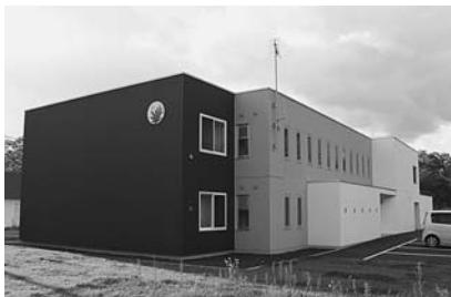
昨年から実施していました公営住宅小沢団地建設工事が完了しました。(事業費：2ヵ年合計 1億4,238万円)