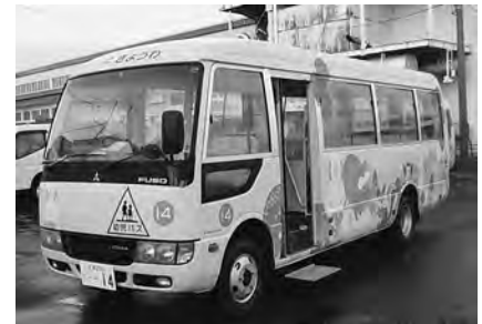
幼児専用バス4台すべての更新を行いました