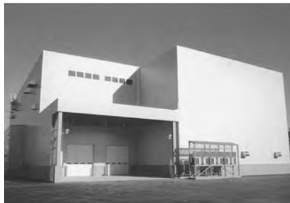
米穀調製貯蔵施設（前田）の改修工事を行いました