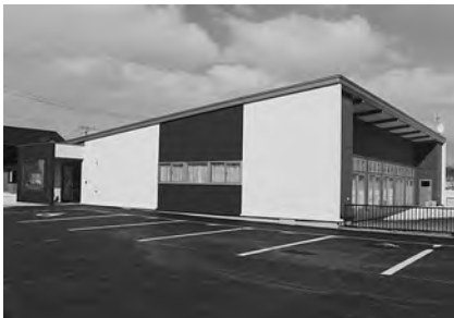
子育て支援センター（南幌似）の建設工事を行いました