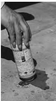
キャップをあけて、口を固い地面などに押し付ける