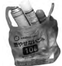
燃やせないごみの袋（青色）に入れて出す