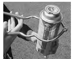
中身を完全に押し出してから行う