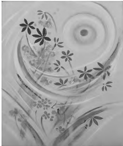
2018年カレンダー掲載作品 西村計雄《花》

5月12日～7月1日の期間中、ご入館いただいた方を対象に「展示作品人気アンケート」を実施します。展示中の西村作品の中から、お好きな作品を1点選んで投票してもらい、最も得票数の多かった作品を2019年のカレンダーに掲載します。