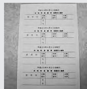
入場券（ハガキ）の見本