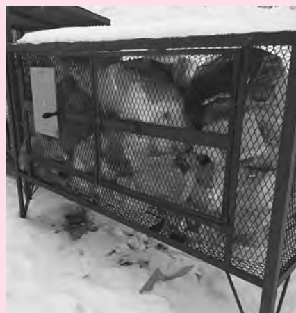
違反ごみで収集できなくなったごみステーション